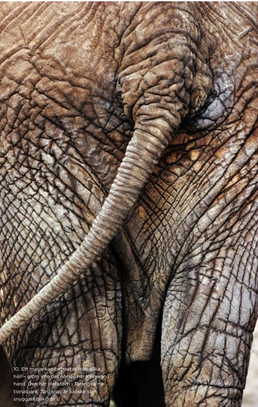
10. Ett motiv kan betraktas från olika håll – glöm inte det när du har kameran i hand. Den här elefanten i Tarangire nationalpark, Tanzania, är kanske som snyggast bakifrån?

Jobba dig fram till bästa vinkeln och vänta gärna en stund – vem vet vad som kan vandra in i din komposition.