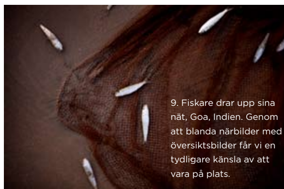
9. Fiskare drar upp sina nät, Goa, Indien. Genom att blanda närbilder med översiktsbilder får vi en tydligare känsla av att vara på plats.

10 . TÅLAMOD ÄR EN BRA EGENSKAP. Lämna inte ett bra motiv efter bara ett knäpp. Jobba dig fram till bästa vinkeln och vänta gärna en stund – vem vet vad som kan vandra in i din komposition.